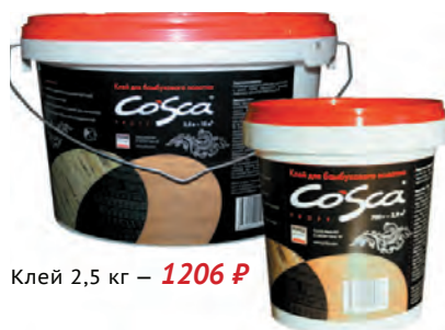
Клей 2,5 кг – 1206 ₺

Бамбуковые полотна «Натур» из серии «CLASSIC» Вы можете самостоятельно тонировать и покрывать лаком (рис.24).